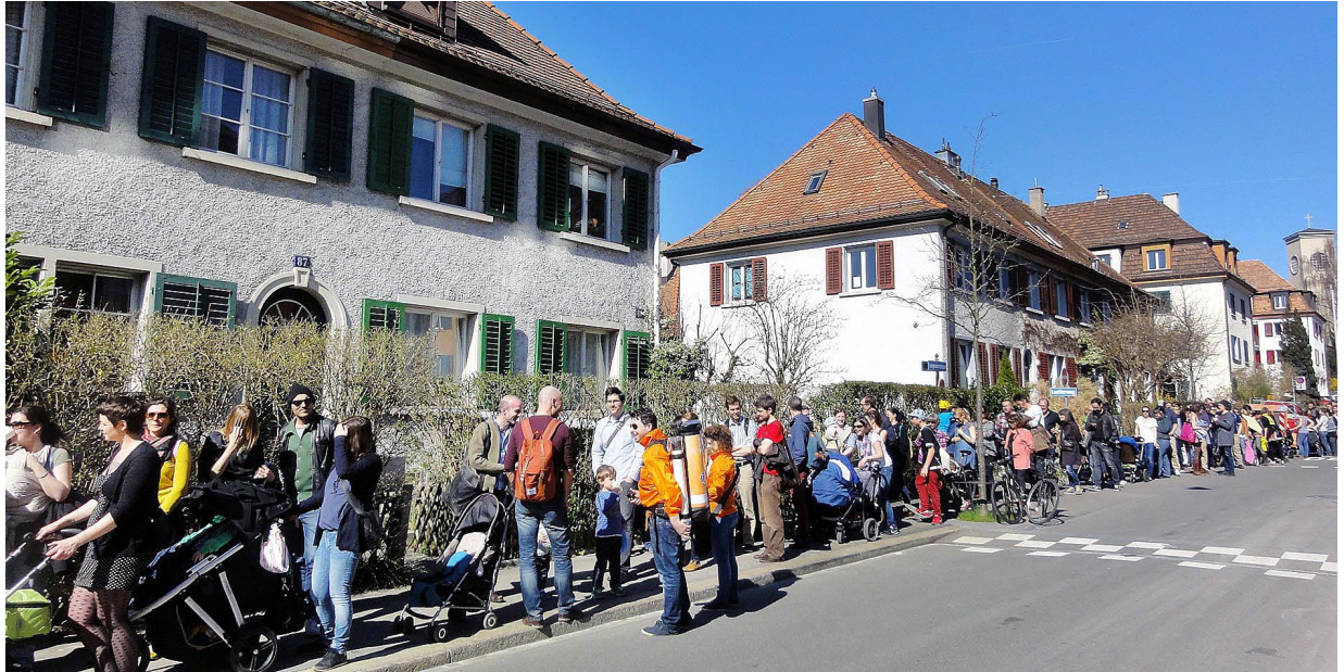
Coda di persone interessate a visitare un appartamento a Zurigo nel marzo 2014