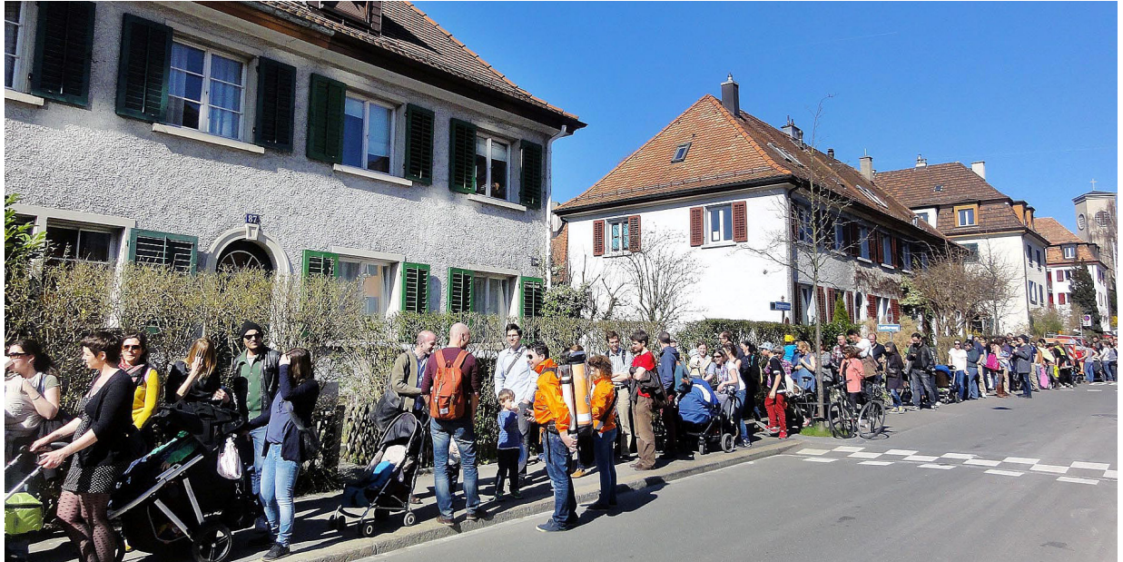
Personnes à la recherche d'un logement en train de faire la queue en mars 2014 à Zurich

«A chaque fois que je vais à Zurich, je me retrouve à faire la queue avant de visiter des appartements qui n'ont au final rien d'extraordinaire!»