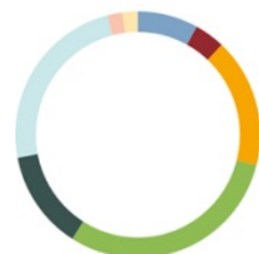
ANTEIL DER KOSTENPUNKTE AN DEN GESAMTKOSTEN (SZENARIO 2) in Prozent

Kilometerkosten: 14 270 Franken / 20 000 Kilometer = 0.71 Franken